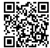
申込専用フォーム

パソコンの方は、 https://forms.gle/dXesqzgFyfxQ7PJdA （問合せ先のホームページにもリンクあり）